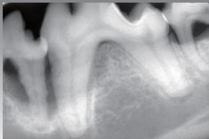
同じわんちゃんのX線。顎の骨が溶けています。