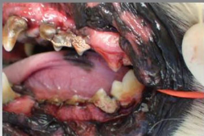
重度歯周病のわんちゃん

また人から動物、動物から人へも感染することがありますので放置しておくは大変です。